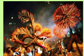
100年以上の歴史がある「魔除けの龍舞い」