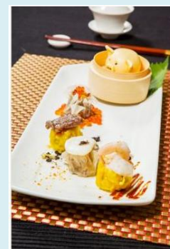
受賞料理イメージ

「叙福樓海鮮酒家」 エビとキノコの盛り合わせ「虎踞山巒」 「新星海鮮火鍋酒家」(青衣店) エビの盛り合わせ「玉龍子母蝦」 「彩晶軒」(荃灣店) エビともち米料理「紫霞盤龍雙弄」