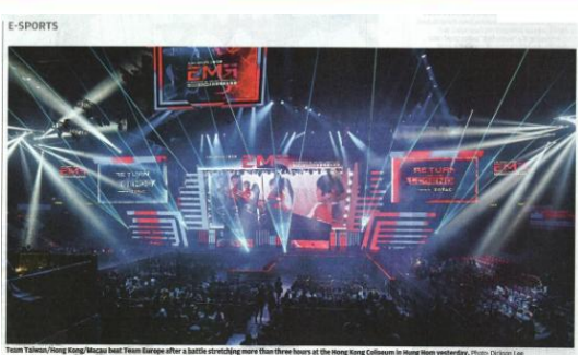
Team Taiwan/Hong Kong/Macao Best Team Europe after a battle extending more than three hours at the Hong Kong Coliseum in Hong Kong yesterday.