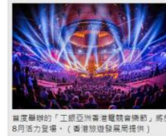
首度舉辦的「工銀亞洲香港電競音樂節」將於8月活力登場。

【記者莊士賢／台北報導】今夏的香港很熱鬧！結合電競、音樂、美食的「工銀亞洲香港電競音樂節」將於8月活力登場，帶給旅人不一樣的夏遊香江樂趣。香港旅遊發展局也推薦夏日狂歡慶典、微醺沁涼夜生活、極致消暑創意冰品、瘋買時尚潮物、尋訪無敵海景等五大消暑體驗，讓旅人體驗不同的夏日香港風情。