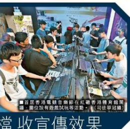
■時屆香港電競音樂節在紅磡香港體育館開幕，圖位及有遊戲试玩等活動。