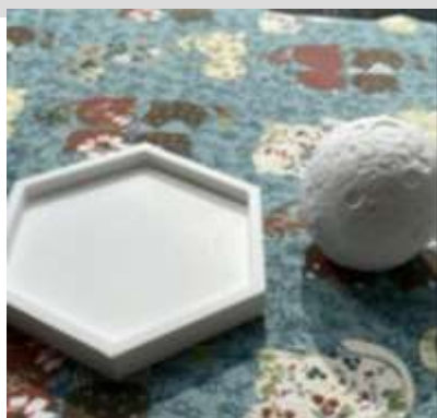
擴香石 DIY 工作坊