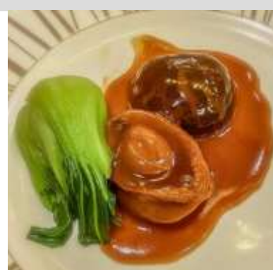
星級酒店高級海鮮晚餐