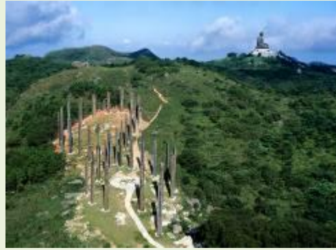
ハートスートラ(心經簡林)/ランタオ・トレイル