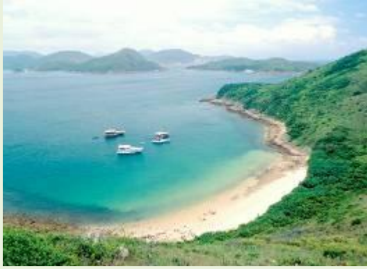
浪茄灣のビーチ/マクリホース・トレイル