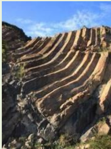
六角柱状節理/萬宜ジオトレイル、大浪灣ハイキングトレイル