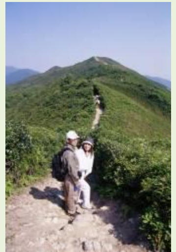
ドラゴンズ・バック/香港トレイル

【ハートスートラ】ランタオ島のパワースポットと言われ、丘の広場には僅か260の漢字で書かれた般若心經の經文を刻んだ木柱38本が、無限を意味する「∞」の字形に並べられています。丘の最も高い場所に位置する木柱は、ハートスートラの主題である「空虚」の概念を示すために、經文は刻まれず空白になっています。