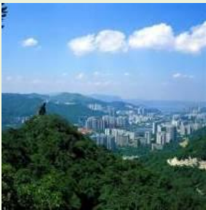
望夫石/ウィルソン・トレイル