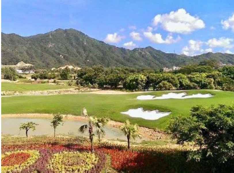
珠海ゴルフクラブ