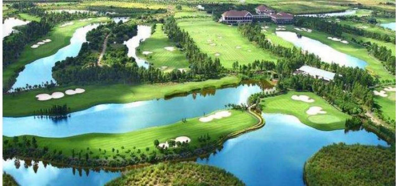
珠海金灣ゴルフクラブ