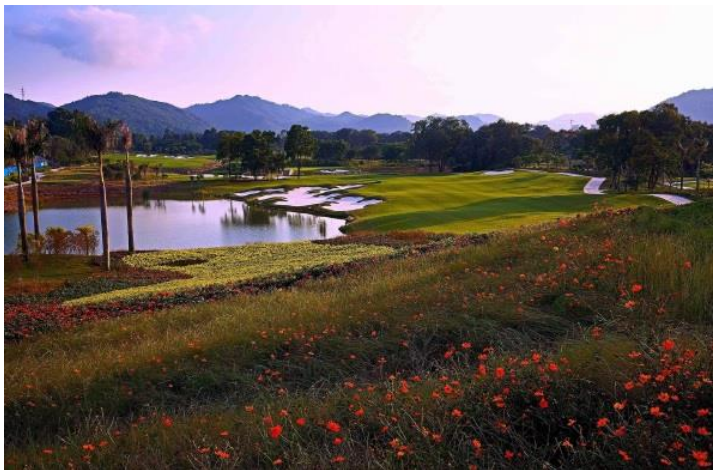
珠海レイクウッドゴルフクラブ