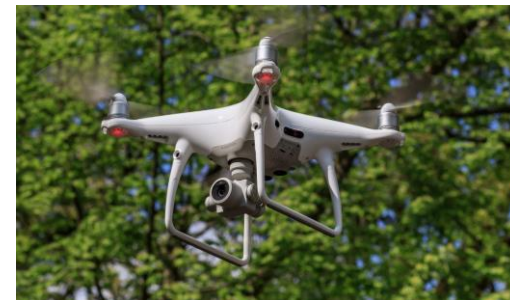
DJI、AEE、MMCといったドローンメーカーも深圳に集中