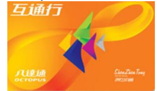
トークンと互通行カード