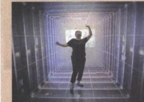
美荷樓古蹟裡也有現代新玩意。