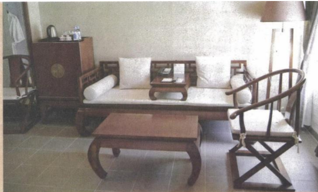
昔日療養院變客房，吸引不少歐美客搶體驗。