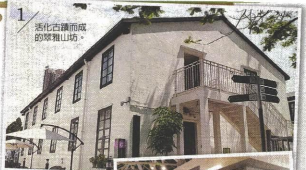
1 活化古蹟而成的翠雅山坊。

而位於深水埗的「美荷樓生活館」免費開放參觀，館內複製當初的浴室、洗手間、雜貨店及居住單位等場景及文物陳設，可瞭解1950至1970年代香港公共屋邨居民的生活點滴。至於「YHA美荷樓青年旅舍」則有129個房間，規畫有4人家庭房、雙人房及8人房。