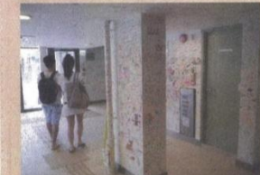
美荷樓變身青年旅館，牆上滿是塗鴉。