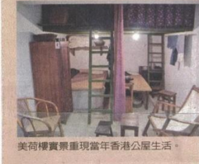
美荷樓實景重現當年香港公屋生活。