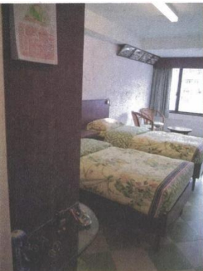
美荷樓簡潔素雅的客房。