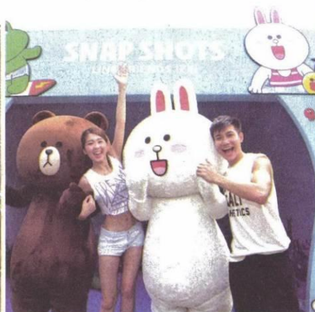
「LINE FRIENDS快拍」有熊本和兔兔驚喜現身，與遊客在繽紛海底布景前拍下有趣合照。