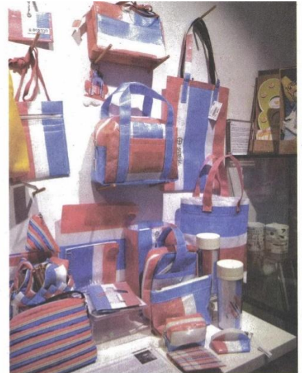
元創方變成文創中心。