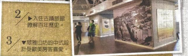
2 入住古蹟旅館瞭解百年歷史。