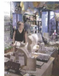
元創方的創意小物特別多。

饒宗頤文化館建築群下區設有藝術館、保育館及接待處，各景點及館藏開放參觀；中區設有多用途廳、綜藝小劇場、靜心堂及餐廳，戶外則有九龍關地界碑石、學圃和爬山廊。上區則是病房改裝的客房，去年中旬酒店以「翠雅山房」為