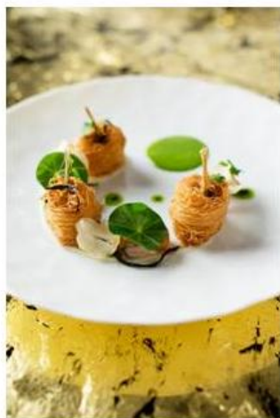
Amber 招牌菜式 酥脆香料法國田雞腿配長崎辣片及義大利歌芹泡沫