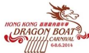
香港龍舟嘉年華免費啤酒登記