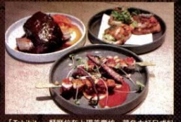
「Tabibito」餐廳位在上環荷李活坊，菜色主打日式料理。

為服務往返香港與世界各地的商務旅客，「逸連堂」室內黑色花崗岩與橡木地板牆面，增添溫暖自在感，寬型百葉窗襯托青銅牆壁，帶出餐飲和酒吧的典雅。特別的是，貴賓室配有9間淋浴間，其中包括1間適合傷殘人士使用，以及12處私人工作間，提供乘客隨時接收最新資訊，希望讓旅客獲得心情暫時的放鬆。