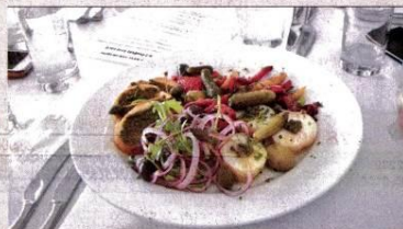
地中海餐廳Cococabana的菜色很「海」味。