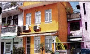
石澳風景優美，村莊建築物很有歐陸風情。