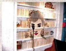
荷李活道藝術餐廳「Bibo」，室內裝潢充滿親暱衝擊。

間吸引大批粉絲造訪，蛋糕、主餐皆以大量Kitty貓圖案做裝飾，讓粉絲捨不得品嚐。裝潢則以翠綠色調，配合園林點綴成Kitty貓溫暖的家。由於該店正式營業，讓原本只是經營汽機車修理的大坑知名度暴增，每日遊客以倍數激增，帶動周邊觀光人潮，食在有意思。