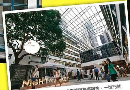
「PMQ元創方」前身曾是中央書院與警察宿舍，一進門就看得出闊潔、秩序的建筑風格。

「PMQ元創方」前身最早是「中央書院」，是香港第一間提供中小學西方教育的公立學校。1951年改建成荷李活道已婚警察宿舍，2000年將居民遷出而閒置，後來列入「保育中環」項目之一，由同心教育文化慈善基金會標得營運權，與香港設計中心、理工大學、知專設計學院合作，活化成創意產業中心。活化過程保留原有建築面貌與中央書院的地基遺址，只有建築外牆重新油漆及更換玻璃。