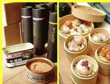
▲可以隨時補充的蠟米，裝入自己喜愛的器皿，更顯個性。(約NT$200/個)