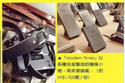
▲「Modern Times」以各種合金製成的隨身小物，用來很帥氣。(約NT$1,920起/份)