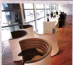
香港國際機場的國泰航空全新啟用的貴賓室，打造尊貴舒適的休閒空間。

小小一包「檸檬王」有何獨特魅力？塊狀檸檬吃起來酸甜有微濕感，品嘗後口中更有檸檬清香，可去痰止咳、緩急止痛、清熱解毒，喜歡這滋味的遊客，近期恐怕要失望了。