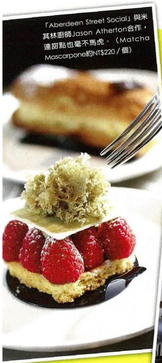
「Aberdeen Street Social」與米其林廚師Jason Atherton合作，連甜點也毫不馬虎。(Matcha Mascarpone約NT$220/個)