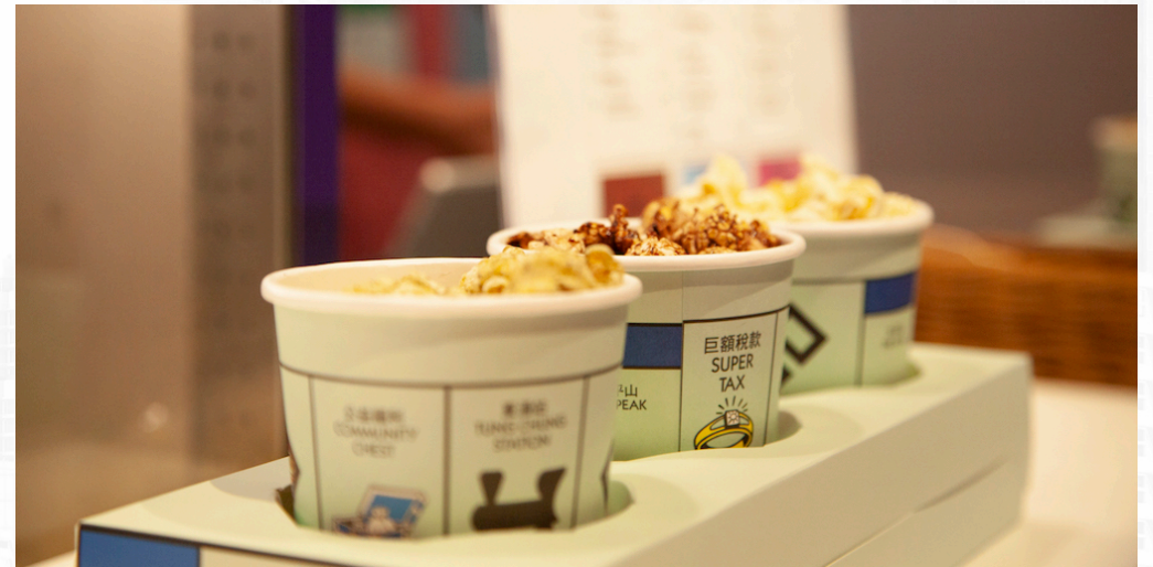
Triple Dreams Popcorn 三式爆米花