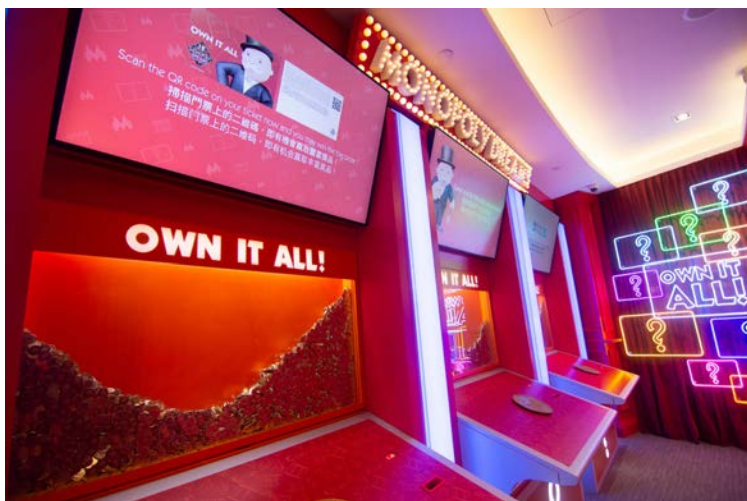
Win a prize at FORTUNE BOARD 在幸運棋盤 贏取終極獎品