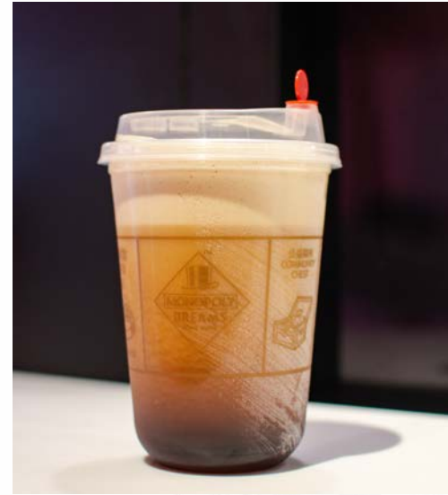
Cold Nitro Coffee 大富翁冷氮咖啡