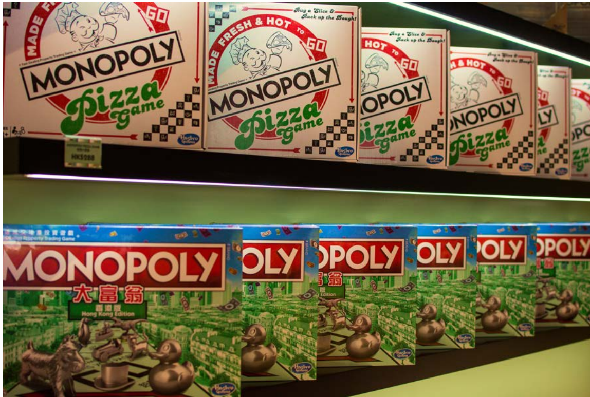
MONOPOLY Limited Edition 限量版大富翁