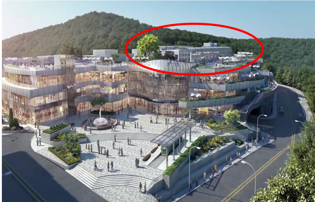
Rendering of the renovated Peak Galleria 新山頂廣場預覽圖