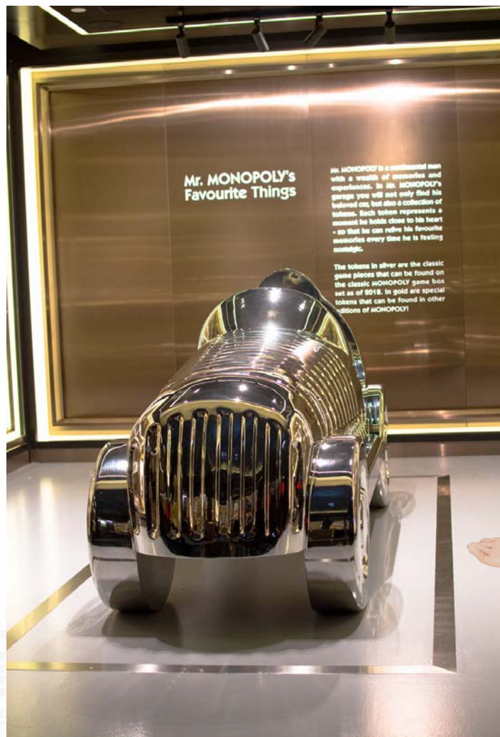
World Biggest Token certified by the Guinness! 健力士認證 大富翁先生超級跑車