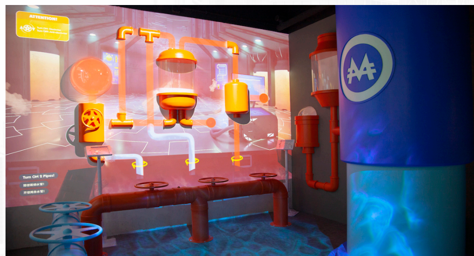
Water Plumbing Maintenance Game at Water Works 大富翁水務局 水管維修靠你了