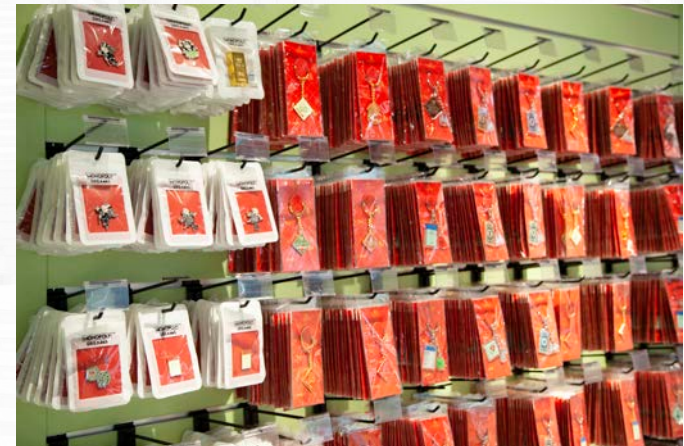
Key Chain 大富翁鑰匙扣