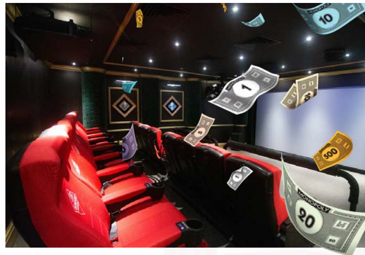
Enjoy 4D Effect at TRAIN STATION 火車站影院 體驗4D特效